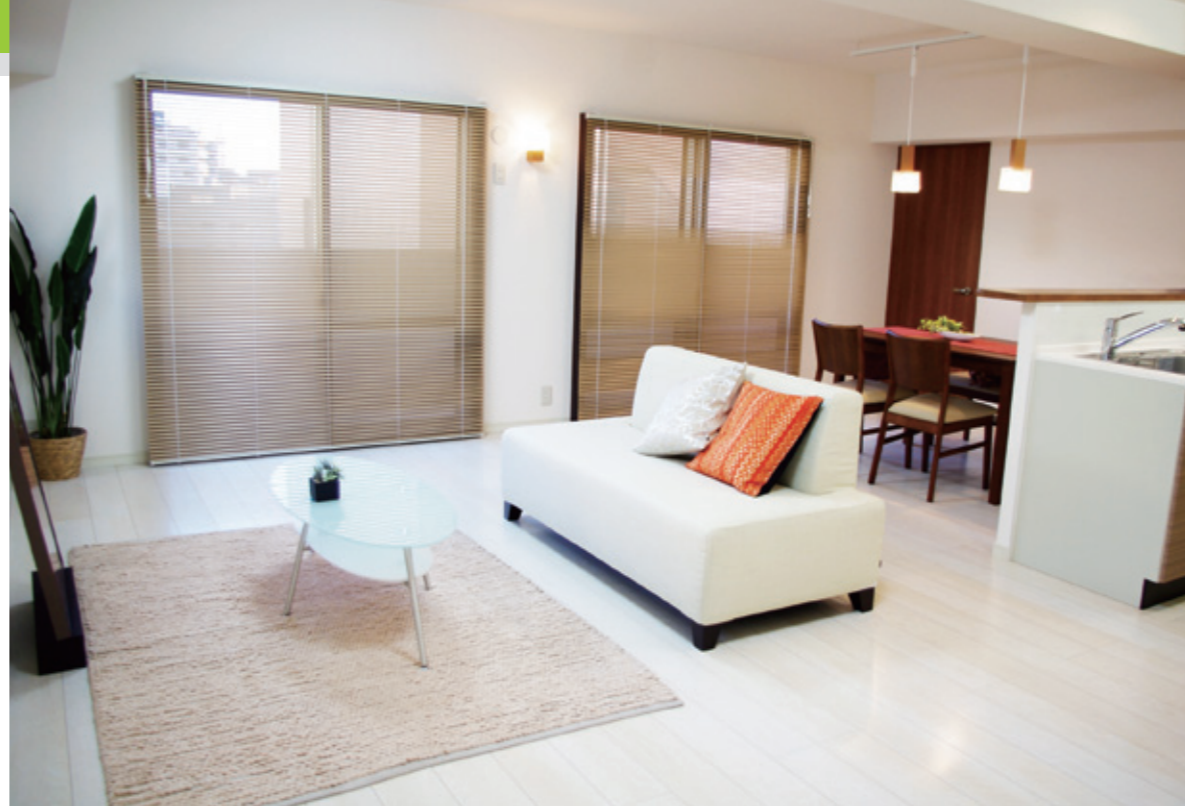
リフォーム済みのリビング。ターゲットエリアの地域特性、家族構成などに合わせたリフォームを行う

「再生住宅」(中古リフォーム物件)に特化し、ターゲットエリアのニーズに合ったリフォームを施したリーズナブルな価格の住宅を提供して、販売実績を伸ばしているリプライス。好評の理由は、プロの厳しい視点での中古物件選別と、ユーザー目線でリフォームする独自の仕組みにある。